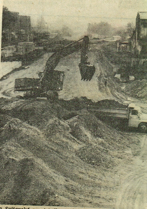
Na Svitauské magistrále začíná být opět živo, jak do...