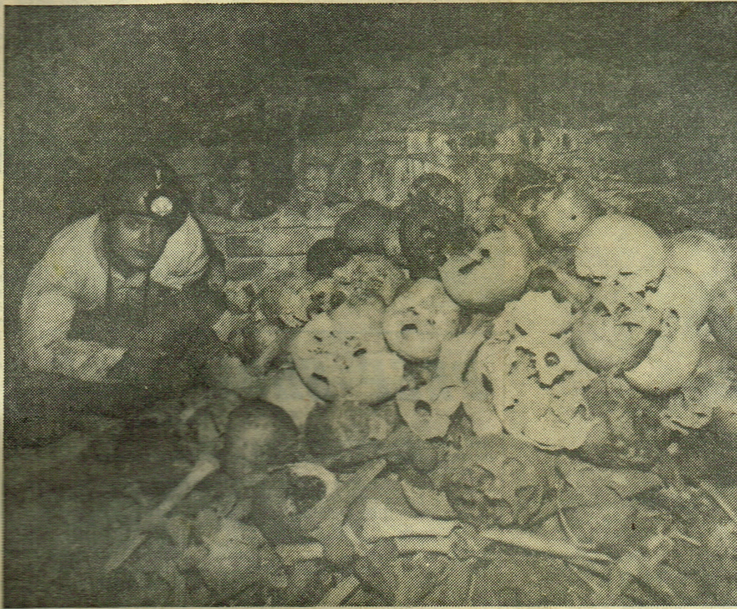
Speleologové Novodvorské sku- piny (ZO 6-12 ČSS) pronikli pod křtinským chrámem do ne- známé krypty, vyplněné téměř ke stropu lidskými kostmi.

terou prezervačníu prá- přísoudu léta, potažmo nická osvětla, náhod - ada - širších dimenzí gumový štít proti smrtici e AIDS a dalším nemocem, jako proti nežádoucímu po- e nyní ocitl navíc v úloze ující okolnosti. Jak uvádí tění tisk, pozornost vzbu- uvedení rozsudek Nejvyššího ho dvora SRN, který se je na delikty znásilnění a e výměr tvrdých trestů. přítěžující okolnost se na- bude posuzovat fakt, když tci během činu nepoužijí nný prezervační. Opatření vy- údajně ze závažných ná- zjištěných nejnovějšími tky medicíny. Novou reklam- t výrobce kondomů bude možná znít třeba takto: Po- tickém výjevu zaplaví obra- u titulky - když násili, tak e s prezervačním! (lka)