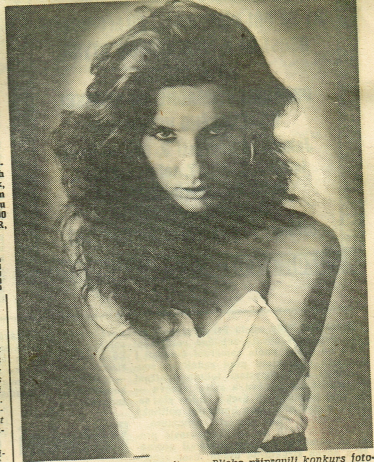
Studio Jef ve spolupráci s firmou Pliska připravil konkurs foto- modelek a manekýnek, spojený s volbou Miss PLISKA 1991. Vítězka získá kromě hodnotných cen také smlouvu na všechny reklamní kampaně firmy. Šanci uplatnit se ovšem nedostane jen ona. Tedy: cítíte-li se být stvořeny k práci modelky či ma- nekýnky, přijďte 8. května ve 14 hodin do prodejny PLISKA, Štefánikova (někdejší Dimitrova) číslo 7.

BRNOTOUR nabízí ITALIE JE NEJKRÁSNEJŠÍ NA JARĚ! Cestovní kancelář BRNO- TOUR nabízí několik volných míst v zájezdu do Benátek, Padovy a Verony s komfortním ubytováním u moře v termínu od 11. do 14. 5. Cena 1490 korun. Informace BRNOTOUR, Kozí 10, tel. 252 83.